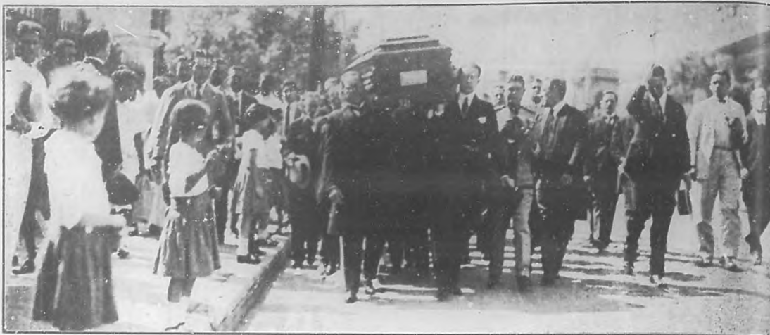
EL ENTIERRO DEL DR. RAIMUNDO CABRERA. —Momentos de ponerse en marcha la comitiva fúnebre que seguía al sarcófago, llevado en hombros por varios familiares y amigos del insigne patricio.