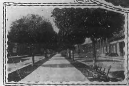
Avenida de la Libertad.