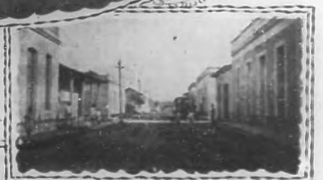
Avenida de la Paz.