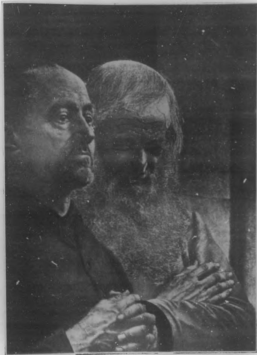
EN LA IGLESIA Cuadro de Jef Leempoels