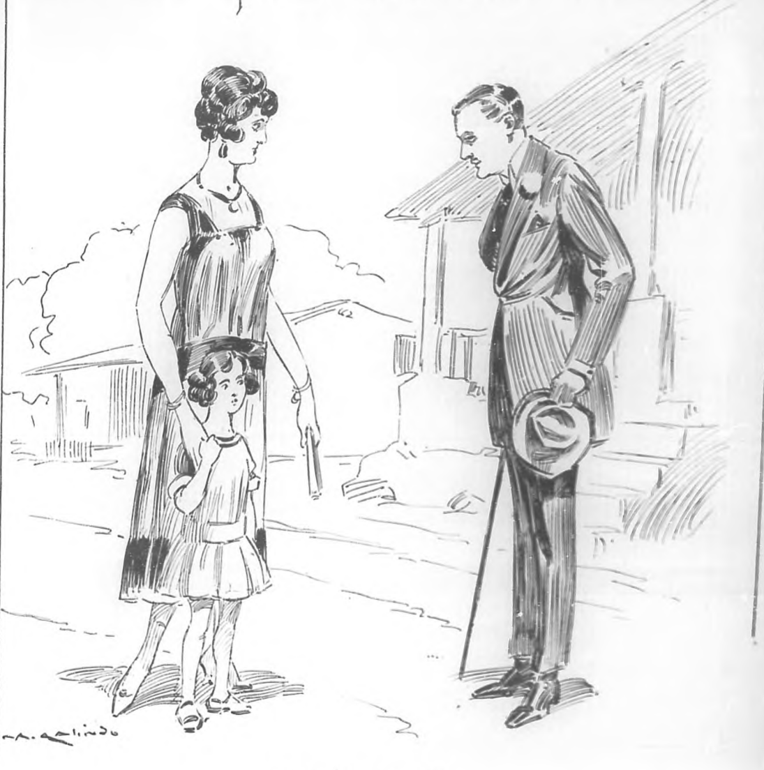
POR RAFAEL U. GONZALEZ