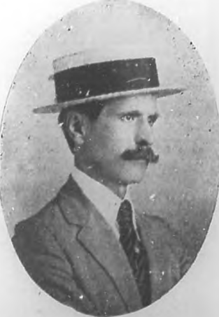
JOSE DE URGELLES Notable barítono español que acaba de realizar una brillante tournée por varias poblaciones de la Florida.

En la próxima edición nos complacemos en publicar dicha fotografía.