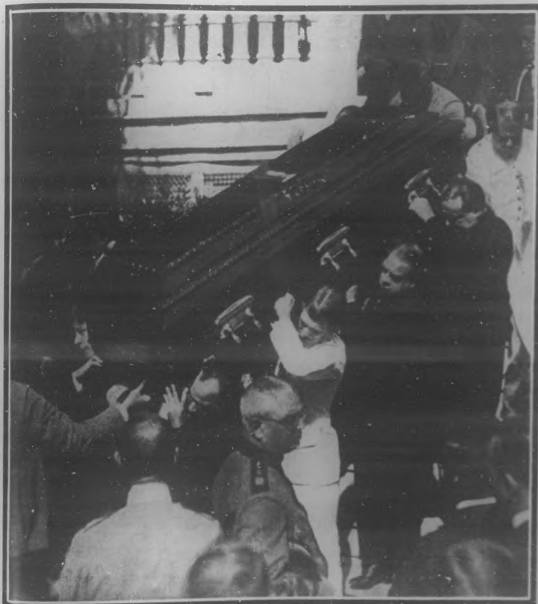
Momentos en que el cadáver del insigne publicista e ilustre patriota era sacado de su residencia en hombros de algunos de sus familiares y amigos para ser colocado en la carroza fúnebre.