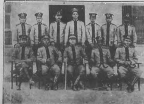
Grupo de vigilantes de caballería del cuerpo de policía de Puerto Padre.