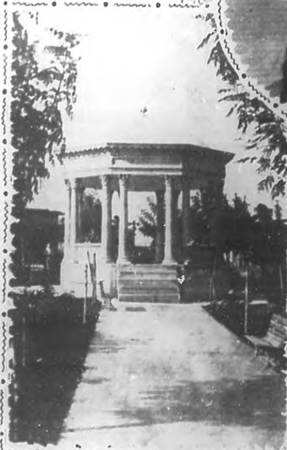
Glorieta del Parque