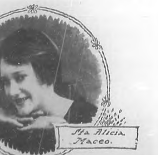
Bellas, simpáticas y distinguidas damitas muy apreciadas en Puerto Padre, de cuya sociedad son gala y orgullo.