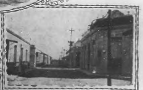
Calle 24 Febrero

las Tunas pasó a depender en el orden municipal de la hermosa ciudad cuyas glorias y progresos hoy nos complacemos en reseñar.