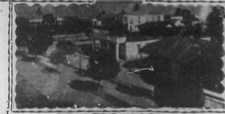
Parte del Pueblo y Bahía

actuación, dejando siempre alguna obra de pública utilidad, como recuerdo imprecioso de su paso por la Alcaldía Mu-