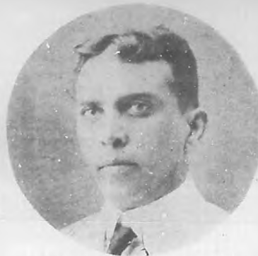
SR. GERARDO PEREZ PUELLES Alcalde Municipal de 1920 a 1927.