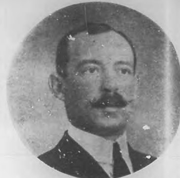
SR. ALBERTO QUERAL Y CARTAYA Alcalde Municipal de Puerto Padre de 1912 a 1920.