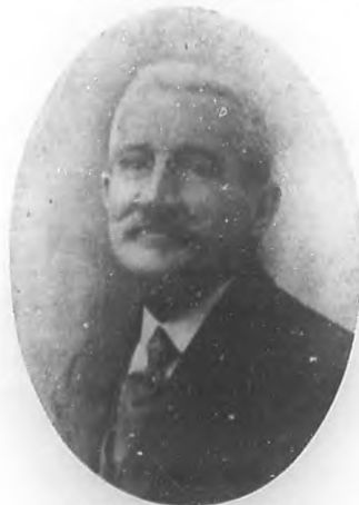
DR. RAIMUNDO CABRERA El insigne publicista, gloria de las letras patrias e ilustre patricio por todos venerado, que falleció recientemente en esta ciudad.

marchar al extranjero, de donde regresará en breve.