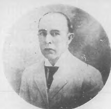
CRNEL DR. FAUSTINO SIRVEN Y PEREZ El primer Alcalde de Puerto Padre en la época republicana.